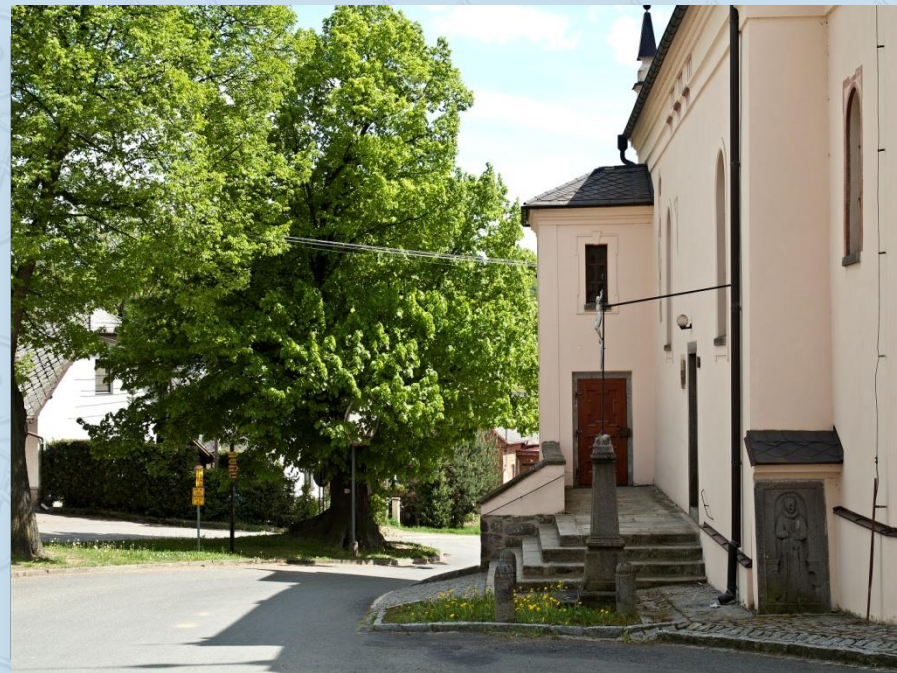
Lípa v Běšinech

Strážov vznikl pravděpodobně v polovině 13. století. Na ostrohu nad Strážovským potokem byla vystavěna pomezní a strážní tvrz, od níž dostala obec svoje jméno. Strážní místo vzniklo k ochraně světelské obchodní stezky, vedoucí z bavorského města Zwiesel železnorudským průsmykem dále do českého vnitrozemí. První písemná zmínka o Strážově pochází z roku 1352, kdy je jmenován jako příslušenství k blízkému hradu Opálka.