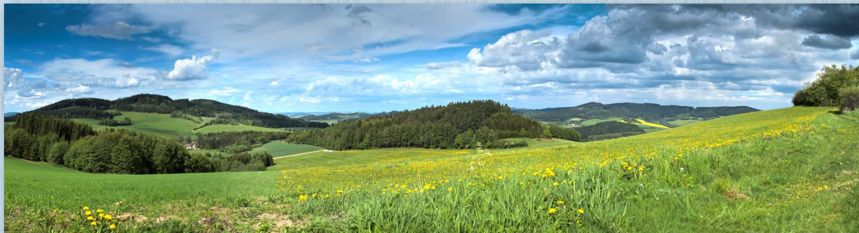
Krajina nad Strážovem

Kaplička v Kozí - od dávných dob stála v Kozí proti hospodě kaplička, o níž se nevědělo, komu je zasvěcena. Po zřízení silnice ze Strážova byla kaplička v jejím těsném sousedství a docházelo k poškozování zdiva povozy. Proto se v roce 1929 usneslo obecní zastupitelstvo postavit kapličku novou na jiném místě. Oltář do ní zhotovil truhlář Wolf z Úloha. Kaplička byla slavnostně posvěcena 6. 10. 1929 a zasvěcena sv. Václavu. Účast na slavnosti byla značná. Za účasti zastupitelstva, místního hasičského sboru a družiček, vyhrávala hudba. Z Běšin přišlo procesí se třemi trůny.